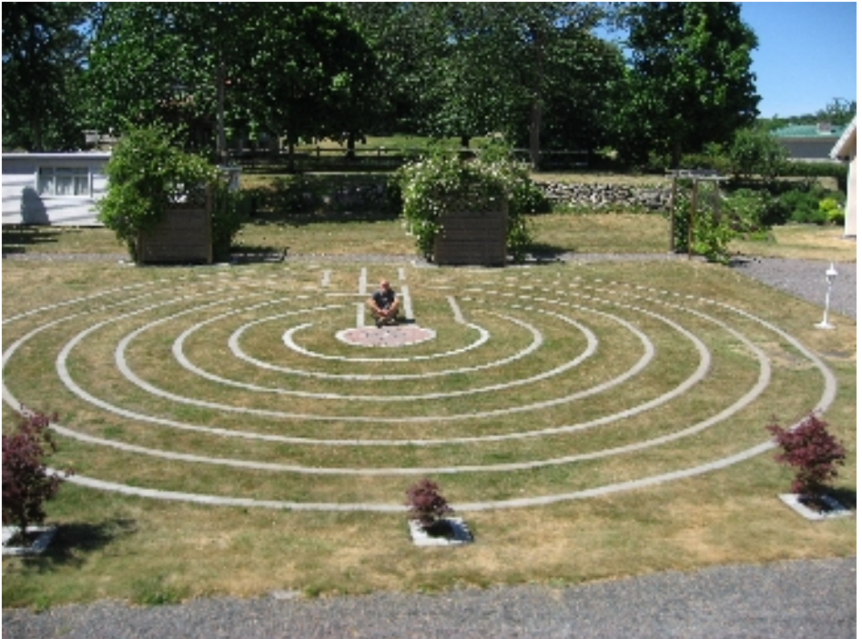
Labyrinten på Røsan

Labyrinten har fascineret mennesker siden oldtiden. Igenennem 3-4000 år kan vi følge labyrintmønstre i mange sammenhænge over det meste af kloden.